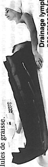
Drainage lymphatique Eureduc® par pressothérapie Eureduc®

Enfin, des résultats sont obtenus sur le traitement de la cellulite, puisqu'il permet l'amélioration de l'élimination des déchets et des toxines, mais il faut bien garder à l'esprit qu'il n'agit pas directement sur les cellules de graisse.